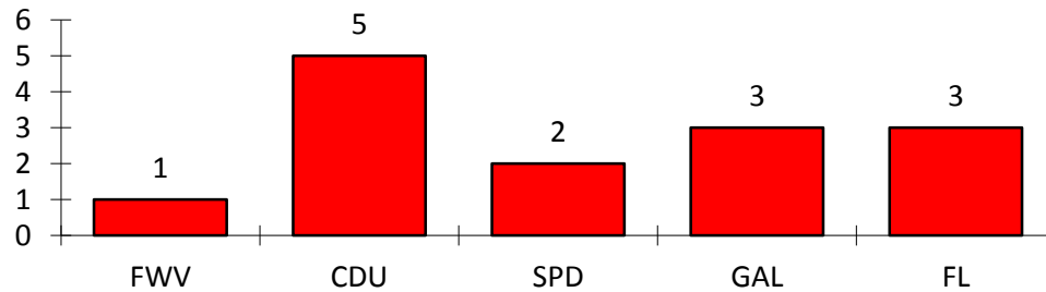
VS Wahlen Verteilung im neuen C Autor Volker nach Sainte-Lague